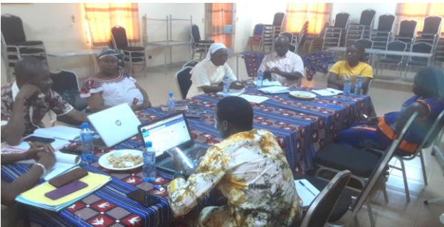
Séance de travail avec l'équipe RBC de ATY

La visite a consisté en des échanges avec les équipes RBC des OP (Chargé de projet, animateur) sur les différents sujets inscrits, suivi de sorties terrain pour visiter des réalisations et des enfants bénéficiaires des interventions.