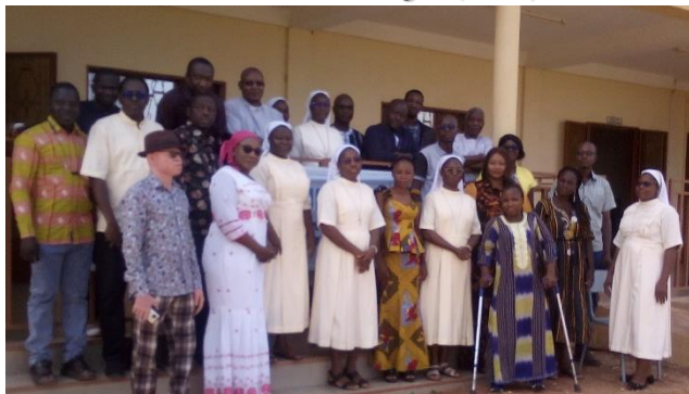
Photo de famille des participants à l'atelier sur la politique de protection de l'enfant de l'ODDS

Etaient présents quinze (15) OP sur les dix-sept que compte le réseau répartis en vingt-huit (28) participants. Les OP Association Tind Yalgré (ATY) de Boussé et