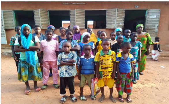
Photo des enfants PDI de l'école Bounouna A de Banfora bénéficiaires des appuis du projet

Les actions du projet sont en cours au niveau des deux régions avec la sélection de 10 écoles et de 300 enfants déplacés internes dont 50 ESH pour bénéficier des appuis divers du projet.