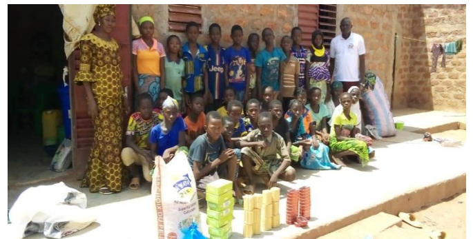
Photo des bénéficiaires des dons

Joignant l'acte à la parole, une quête spontanée a été organisée. La somme récoltée d'un montant de 150 000F a été remise intégralement au Curé de la Paroisse. Avec son accompagnement, l'Organisation Dupont pour le Développement Social (ODDS) a été choisie pour la gestion de ce don.