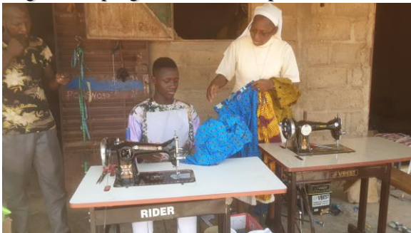
Jeune en situation de handicap placé en apprentissage à TOECE visité

Elles ont aussi exprimé leur satisfaction par rapport au partenariat qui les lie à l'ODDS. Beaucoup d'exemples de réussites ont été relatés aussi bien au niveau individuel que collectif. Des changements positifs de mentalités évoqués ça et là grâce au programme handicap.