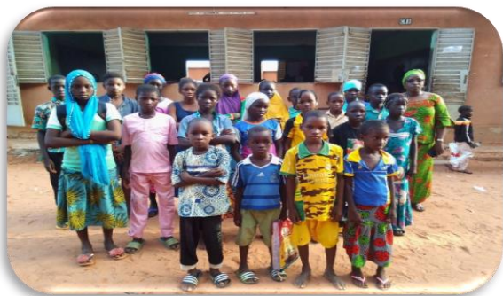
Photo des élèves déplacés internes bénéficiaires directs des actions du projet à l'école BOUNOUNA A -Banfora

C'est en vue de contribuer à la continuité de la scolarisation et de l'apprentissage pour les enfants déplacés que l'ODDS a initié le projet « Appui à la scolarisation des Elevés Déplacés Internes (EDI) » au profit de 300 enfants, jeunes filles et garçons y compris des enfants handicapés d'âge scolaire (6-18 ans) de 10 écoles dans les communes de Banfora et de Dédougou.