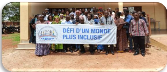
Photo de famille des participants à la formation

L'objectif général de cette activité était de capaciter les acteurs sur le processus de l'inclusion scolaire des enfants en situation de handicap dans la commune de Bobo-Dioulasso et échanger sur leurs rôles respectifs. A la sortie de ces deux sessions de formation les participants ont dit avoir une connaissance des dispositifs juridiques et institutionnels de protection et de promotion des personnes handicapées au Burkina Faso dans le domaine de l'éducation en particulier.