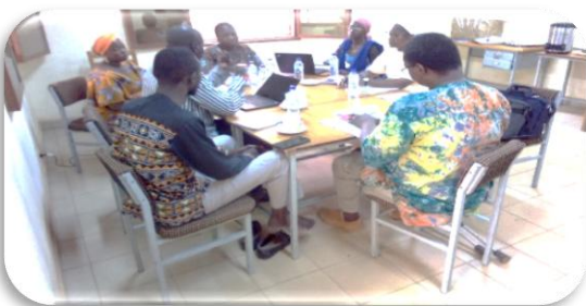
Photo d'une séance de travail avec l'équipe de l'association le Tisserin

A la fin de cette années 2024, les accords de collaboration de l'ONG Handicap Solidaire Burkina (HSB), l'Association Burkinabè pour l'Inclusion des Personnes Atteintes d'Albinisme (ABIPA) et l'Association Le Tisserin, arrivent à terme. L'équipe du programme handicap a effectué une visite terrain du 20 au 24 juin 2024 pour évaluer les progrès réalisés par ces organisations concernées, apprécier les résultats obtenus afin de poursuivre la collaboration avec de nouveaux accords si ces évaluations sont concluantes. Ces évaluations permettent d'apprécier les progrès enregistrés en termes de développement des structures tant sur les plans du management, de la gestion administrative et financière, des capacités de réseautage et de la gestion des ressources humaines indispensable au renforcement de la mise en œuvre des programmes.