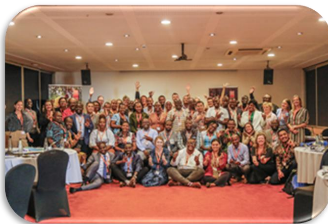
Photo de groupes à la clôture de l'atelier

Nous sommes reconnaissants pour cette opportunité qui a été offerte pour partager nos succès mais aussi nos défis avec les autres partenaires et apprendre de leurs pratiques également.