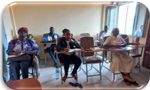
Aperçu du personnel participants à la session

Ces sessions ont permis de jeter les bases d'une responsabilité commune dans la sauvegarde et la protection des enfants. Les témoignages ont enrichi ces séances et les participants sont repartis outillés et engagés pour la protection et la sauvegarde de l'enfant tant au sein de l'organisation