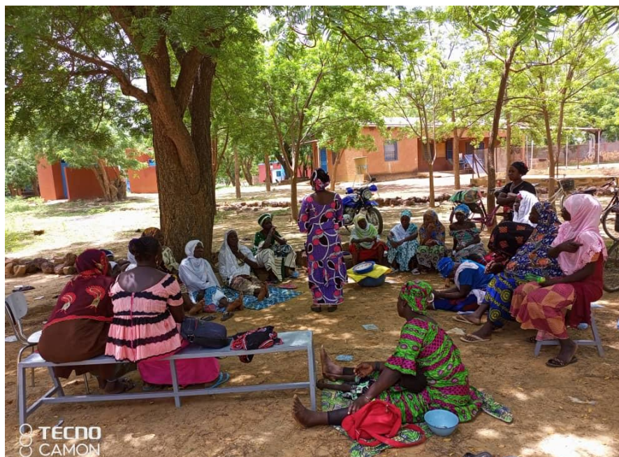
Photo 1 Réunion du groupe AVEC des parents d'enfants IMC de Garango

Aujourd'hui ce groupe a été converti en Association villageoise d'Épargne et de Crédit (AVEC) afin de leur permettre d'accroître leur autonomie financière, et de financer plus facilement leurs AGR et subvenir aux soins de leurs enfants. Actuellement ils ont un capital qui est de 500 425 Frs et le délai de remboursement est de 3 à 6 mois avec toujours le même taux d'intérêt de 10% au moment du remboursement.