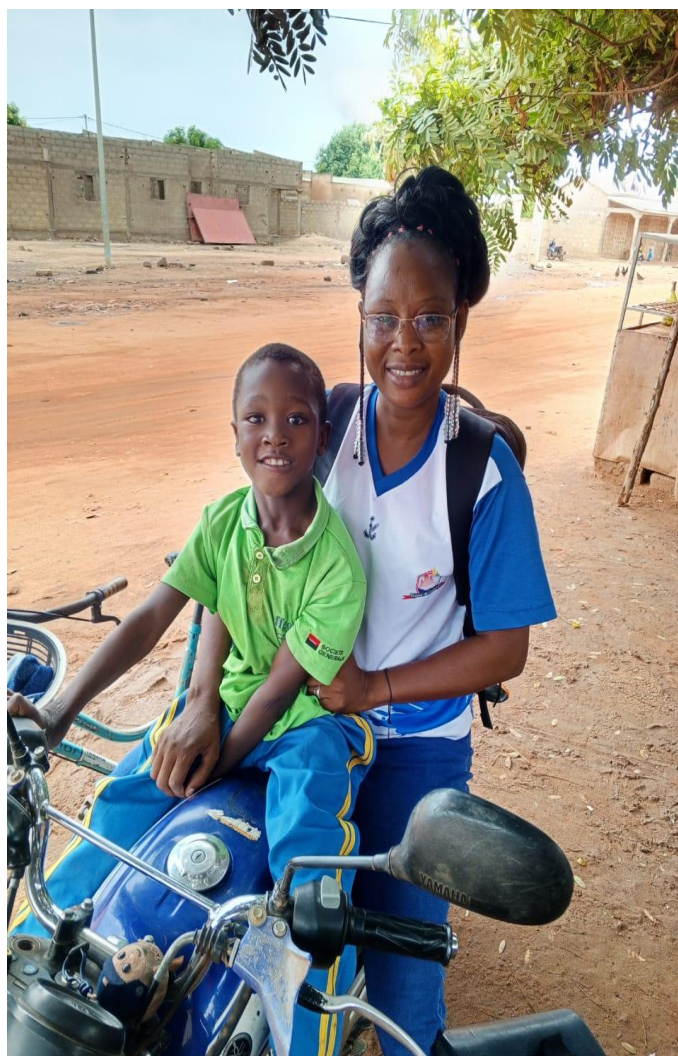
2les agents RBC sont engagés pour la cause des enfants handicapés

Ces contributions des acteurs RBC à la stratégie concourent à optimiser les résultats de l'intervention RBC.